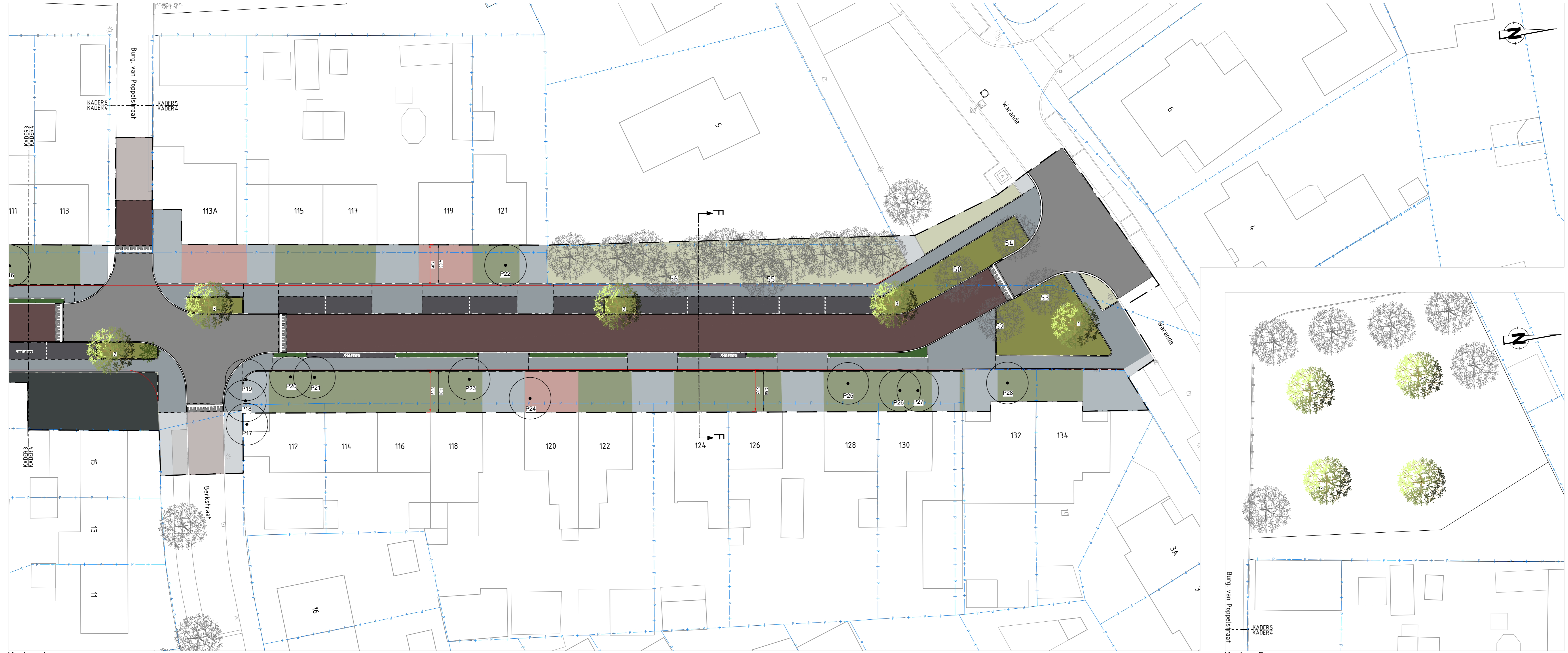
Kader 4 SCHAAL 1 : 200