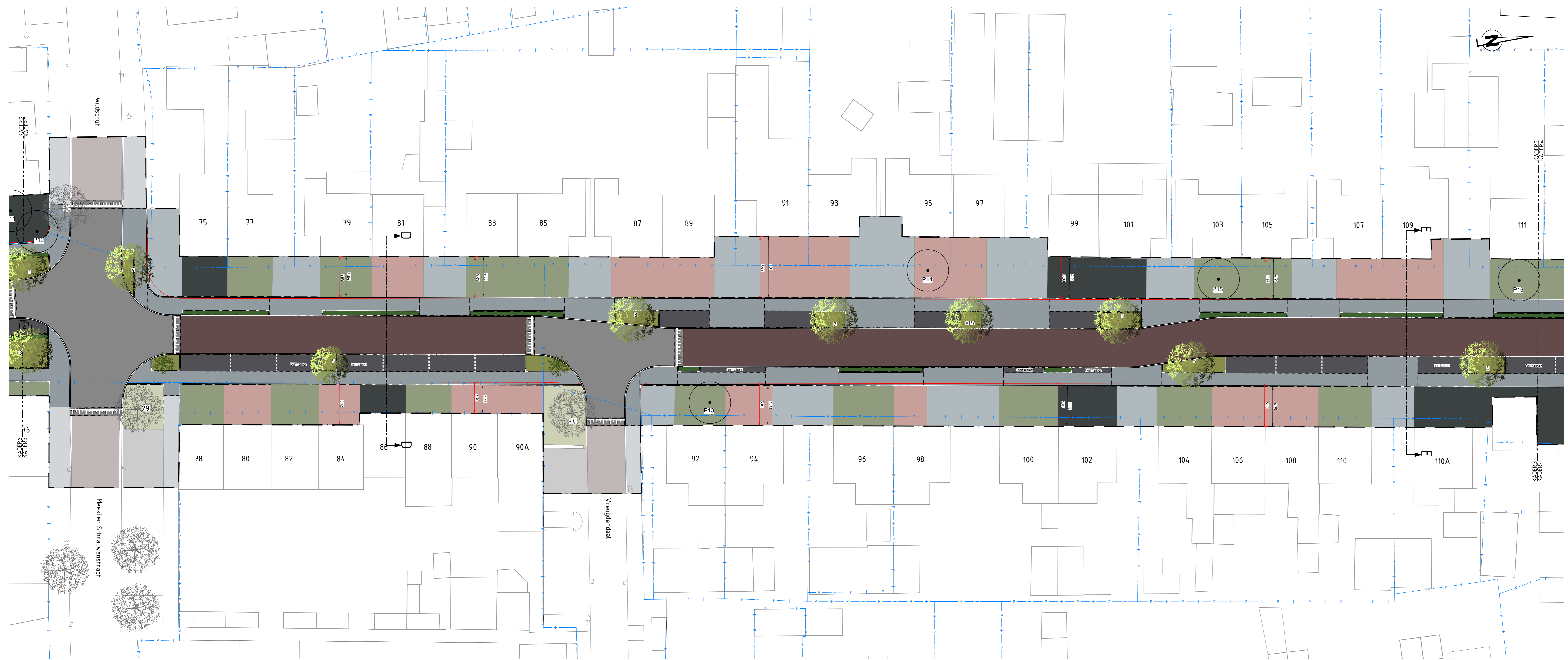
Kader 3 SCHAAL 1 : 200