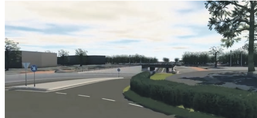
Impressie van de tunnel vanuit de Vijfeikenweg, aan de kant van manege de Vijf Eiken.

U kunt zich aanmelden voor de nieuwsbrief N631 via www.brabant.nl/n631 om op te hoogte te blijven over dit proces.