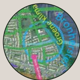
Vliegende Vennen en omgeving