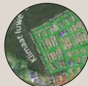
Omgeving Zwembad Tropical en basisschool de Vijf Eiken

“we moeten overstrooming van onze huizen en straten voorkomen door voldoende waterberging te maken”