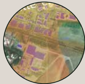
Bedrijventerrein aan de Europalaan en vliegbasis Gilze en Rijen