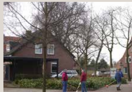
Omgeving stadhuis en winkelcentrum

“bomen en groen zorgen voor verkoeling van de ruimte en voor opvang van water”